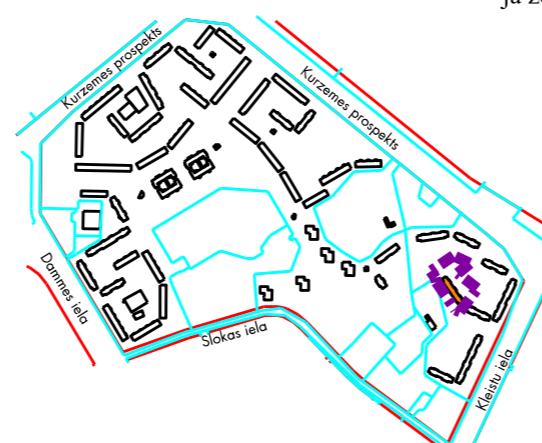
Atrašanās vieta kvartālā: